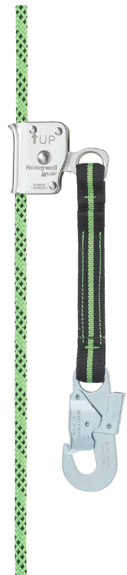
Automatisches RG300, Ø11 mm mit Anschlag 5 Meter