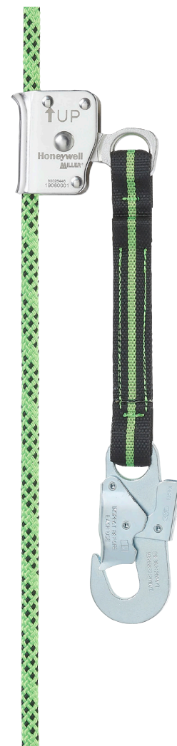
Coulisseau sur corde automatique RG300, Ø11 mm avec cordage