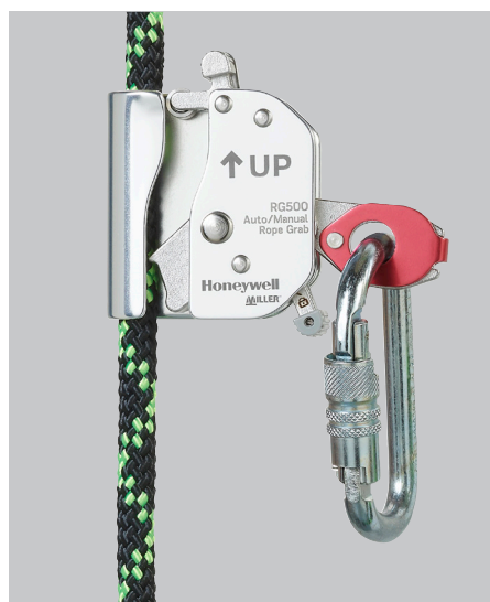
Coulisseau sur corde automatique/manuel RG500, Ø12 mm sans prolongateur de sangle